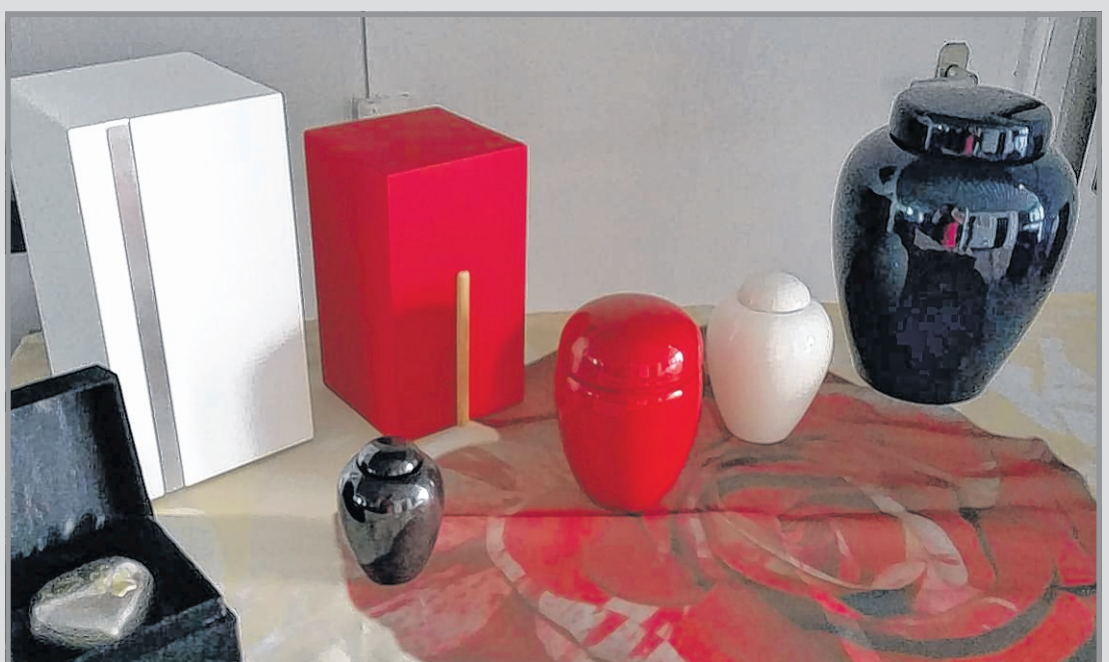
Will ein Tierhalter die Asche seines Lieblings zu Hause haben, steht eine Reihe von ansprechenden Urnen in vielfältigen Variationen und Größen zur Auswahl.

Im Tierkrematorium kann zwischen der Einzel- oder Sammelkremierung gewählt werden. Bei der Einzelkremierung wird die Asche des Tieres in einer individuell ausgesuchten Urne nach Hause zum Tierbesitzer gesandt, um so den treuen Begleiter auch nach dessen Tod bei sich haben zu können. Bei der Sammelkremierung verbleibt die Asche im